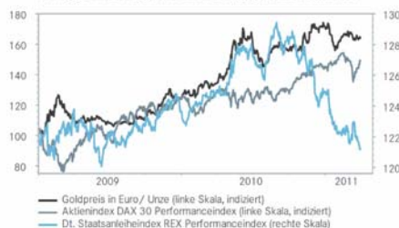
Anleger bevorzugen Sachwerte gegenüber Anleihen