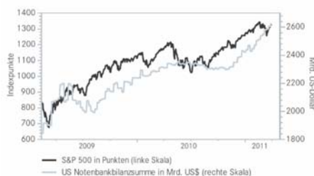
Anstieg der Geldbasis treibt den Aktienmarkt

Quelle: Bloomberg, Deutsche Bank (Datenbasis 1972-2008)