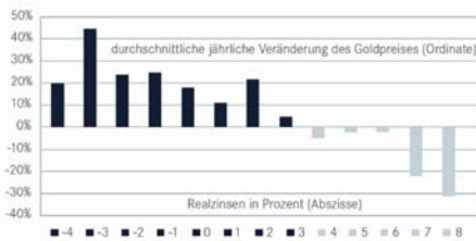
Goldpreis profitiert von negativen Realzinsen